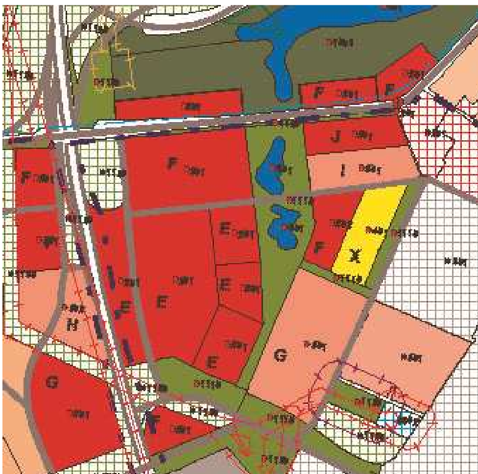
Obrázok 2 Výrez z výkresu Regulácia Územného plánu hl.m. SR Bratislavy v znení zmien a doplnkov