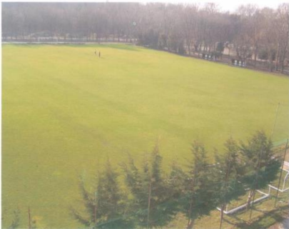
EXISTUJÍCÍ ZRENAJATÉ PLOCHY