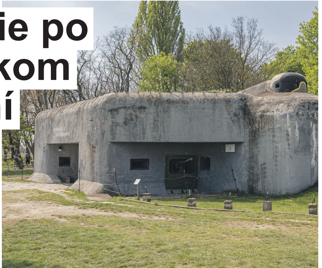
B-S 8 „Hřbitov“

Nevedia rozprávať, no povedia nám toho veľa. Aj najväčšia bratislavská mestská časť má svoje tajomstvá a niektoré z historického hľadiska vynikajú nad ostatnými. K takým patria vojenské bunkre, budované v rokoch 1933 až 1938, ktoré boli súčasťou československého opevnenia.