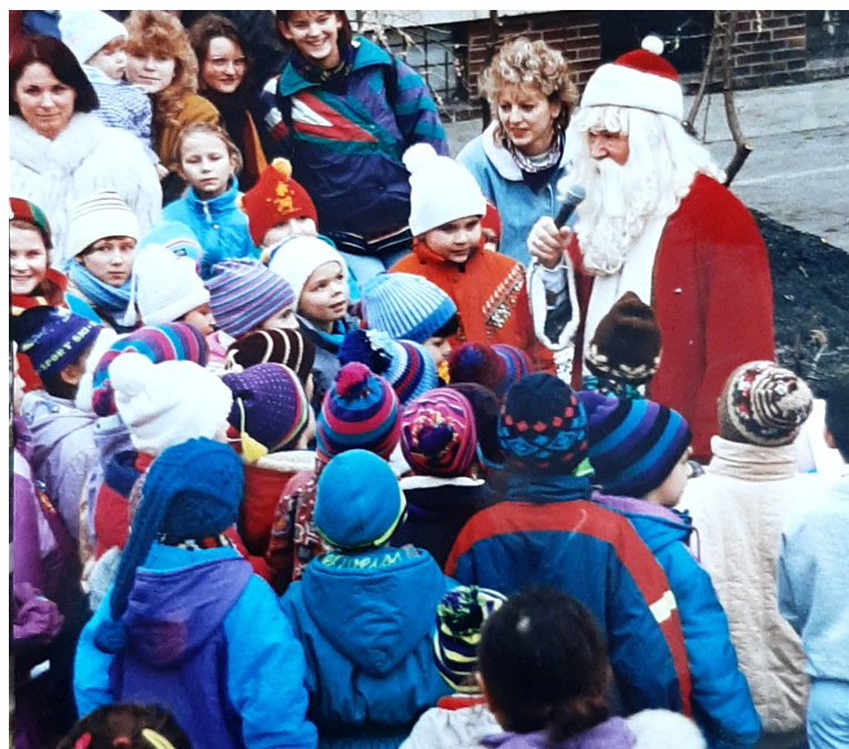
Mikuláš sa prihovára deťom, 1994