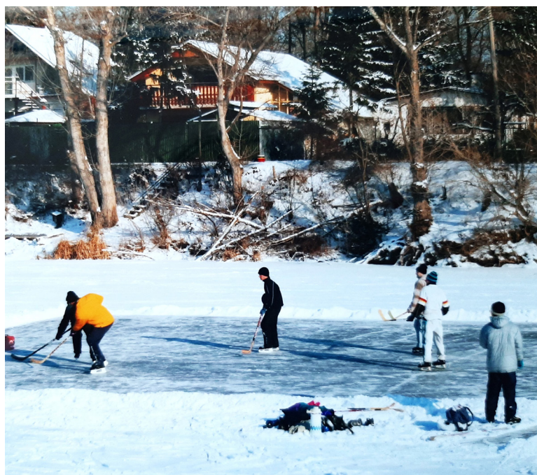
Na Malom draždiaku, 2000