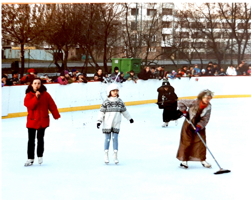
Klízisko na Jiráskovej, 90-te roky

(z básnickej zbierky Cestovný (ne)poriadok , Vydavateľstvo Spolku slovenských spisovateľov, 2015)