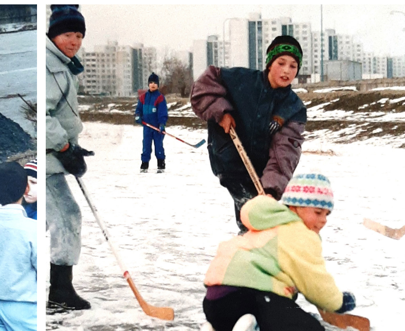
Deti hrajú hokej, 90-te roky