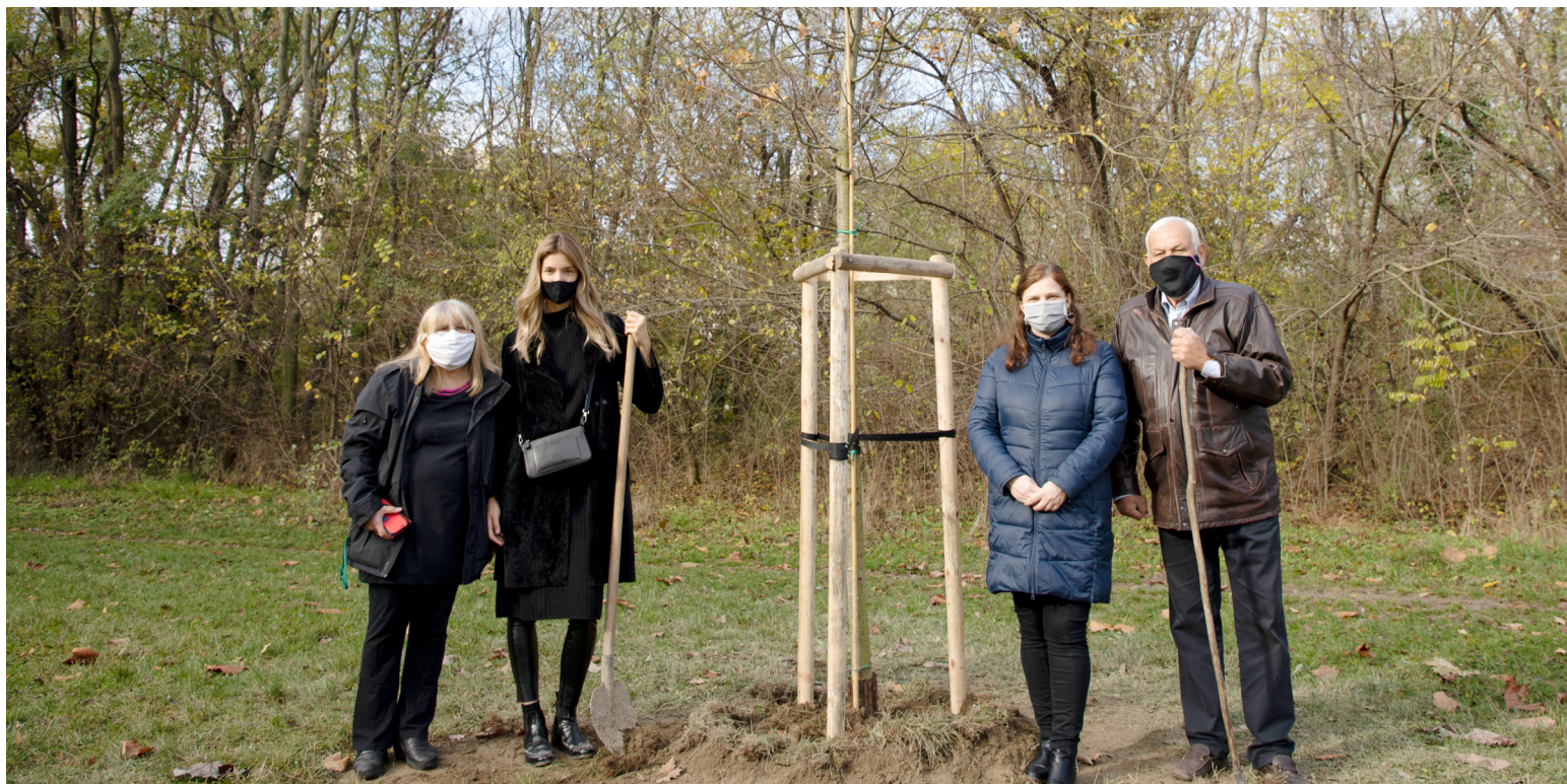
Lúka vďaky

Rok 2020 sa chýli ku koncu a je dôležité, aby odznelo to, čo sa mestskej časti podarilo v oblasti životného prostredia a čo je v pláne pre najbližšie obdobie.