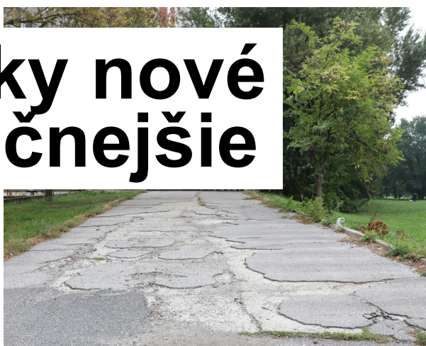
Chodník na Rovniankovej ulici.

Opravy chodníkov na území Petržalky má v réžii Referát technických činností mestskej časti, práce realizuje zazmluvnená dodávateľská firma. Všetky práce