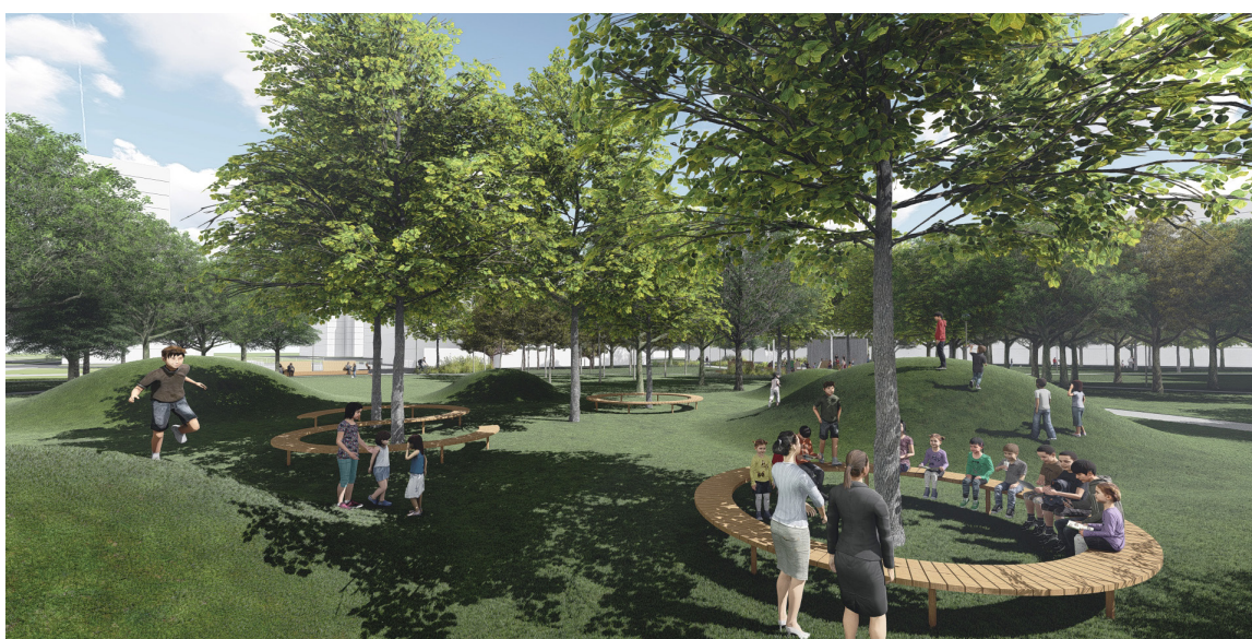
Šrobárovho námestie — štúdia.

V celom procese bude opäť možnosť pre Petržalčanov vyjadriť svoje pripomienky a prípadné návrhy. Všetky aktuálne informácie o prebiehajúcom procese nájdete na stránke namestierepubliky.sk