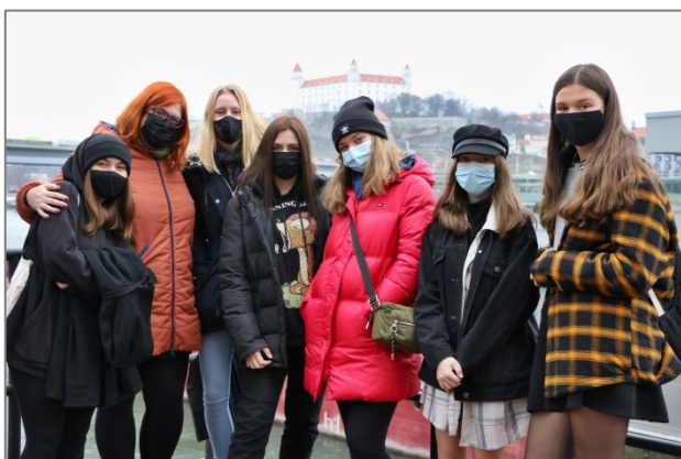
Školský projektový tím ZŠ Dudova

Nosnú časť projektu tvorili Školské programy „Zmena klímy a Dunaj“ – vzdelávacie aktivity na základných školách, v rámci ktorých zapojené učiteľky vypracovali a odskúšali metódy neformálneho vzdelávania žiakov druhého stupňa. Na realizácii projektu spolupracovalo celkovo 7 učiteliek a 42 žiakov 7. až 9. ročníka. Za slovenského partnera išlo o tri petržalské „zelené školy“ – ZŠ Dudova, Holíčska a Pankúchova.