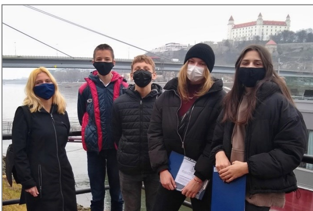
Školský projektový tím ZŠ Holíčska