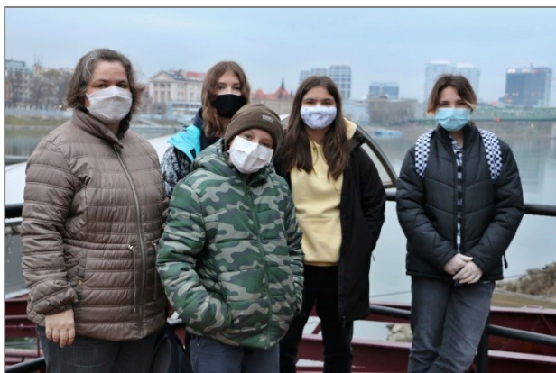
Školský projektový tím ZŠ Pankúchova

Keďže išlo o neformálne vzdelávanie na tému životné prostredie, učiteľky aj žiaci mali v pláne mnohé praktické aktivity vonku, v prírode pri Dunaji. Do priebehu realizácie školských aktivít však výrazným spôsobom zasiahla epidemiologická situácia, z dôvodu čoho prišlo k prehodnoteniu realizácie projektu a časť aktivít sa následne uskutočnila online formou. Žiaci pracovali samostatne i v skupinách, diskutovali o vybranej téme, vyhľadávali potrebné informácie, riešili zadané úlohy a nadobudnuté poznatky na záver spracovali do podoby projektovej prezentácie. Pôvodne plánovanú cezhraničnú projektovú aktivitu Spoločný kemp pre deti a výmena skúseností medzi učiteľmi nahradilo natáčanie videí v priestoroch lode kotviacej na Dunaji. Audiovizuálne prezentácie žiackych aj pedagogických prác si slovenské a maďarské školy medzi sebou následne vymenili.