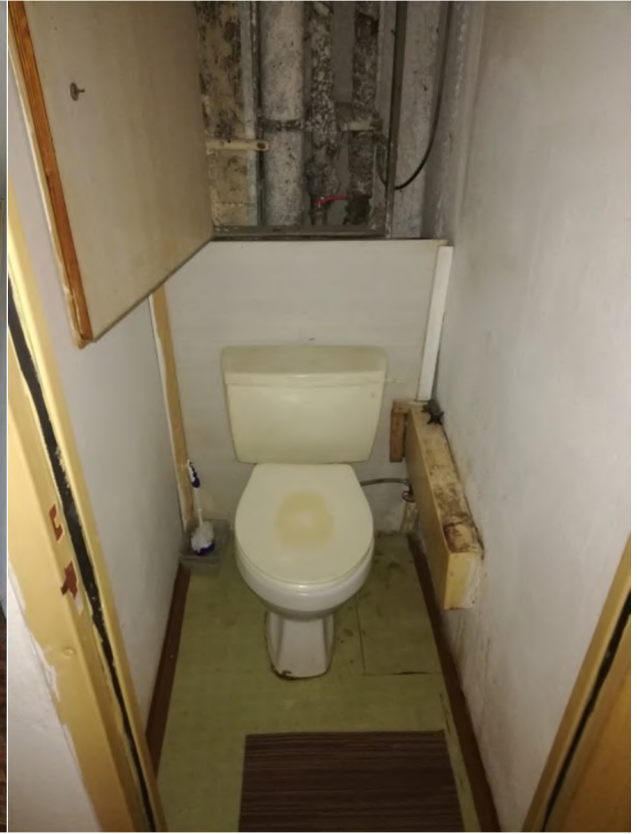
1. Izb. byt