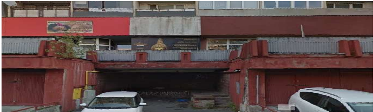
Pôvodný stav :