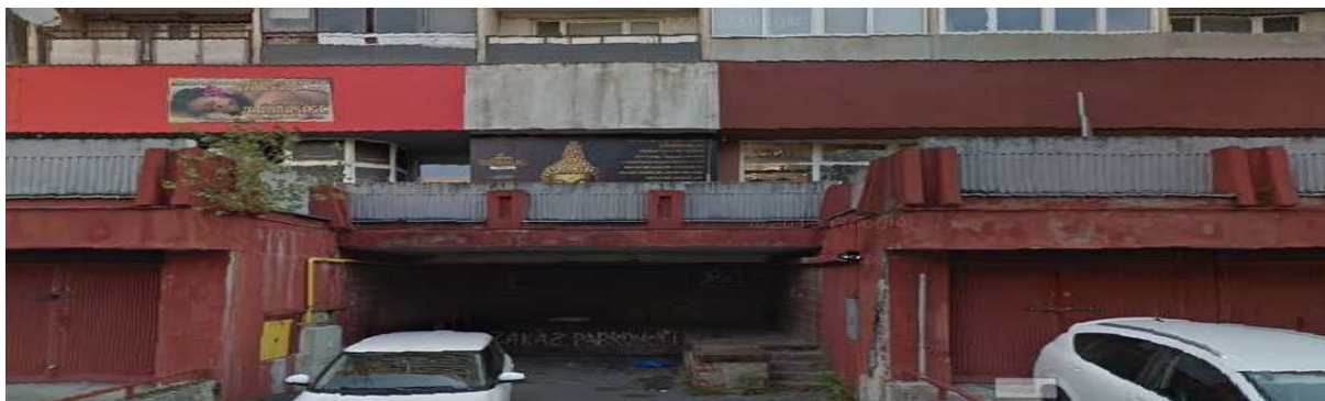
Pôvodný stav :