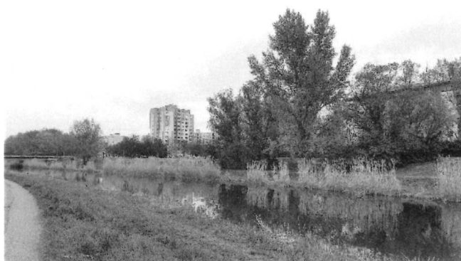
Peší prístup k prístavu plavidiel