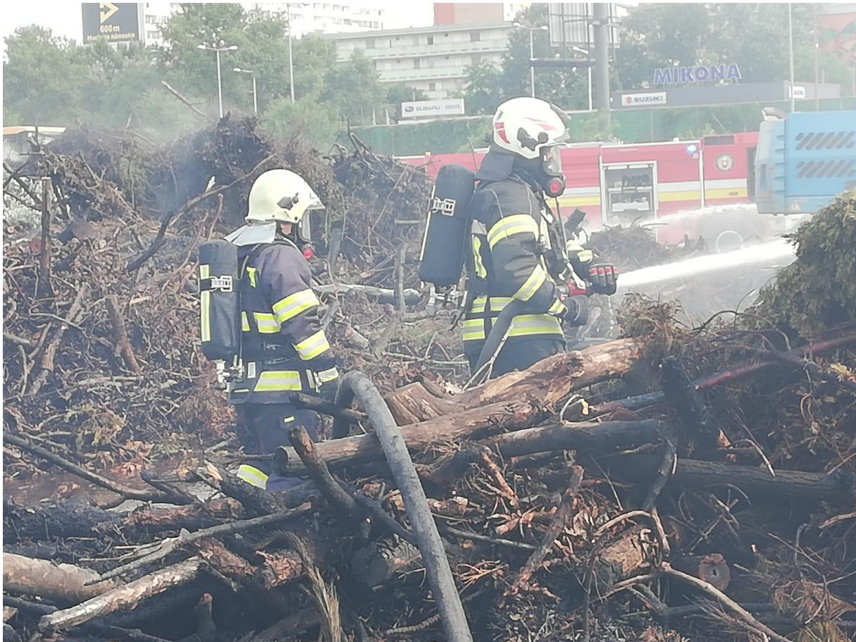
Požiar EKO podnik Bučina, Kočánkova ulica, Bratislava, 28.06.2021