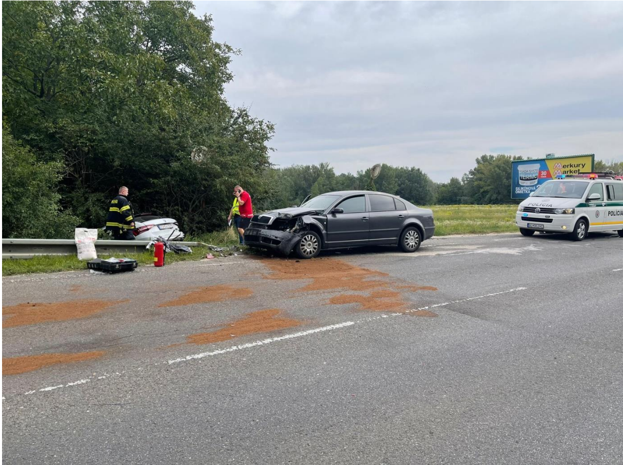
Dopravná nehoda, štátna cesta I/2, 07.09.2021