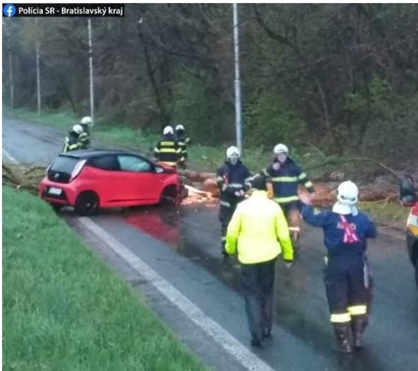
Dopravná nehoda, padnutý strom, Einsteinová x Dolnozemská cesta 12.04.2021