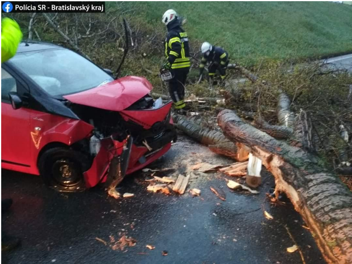
Dopravná nehoda, padnutý strom, Einsteinová x Dolnozemská cesta 12.04.2021