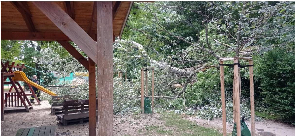
Popadané stromy na multifunkčnom ihrisku ZŠ Dudova 2, Bratislava 15.08.2021