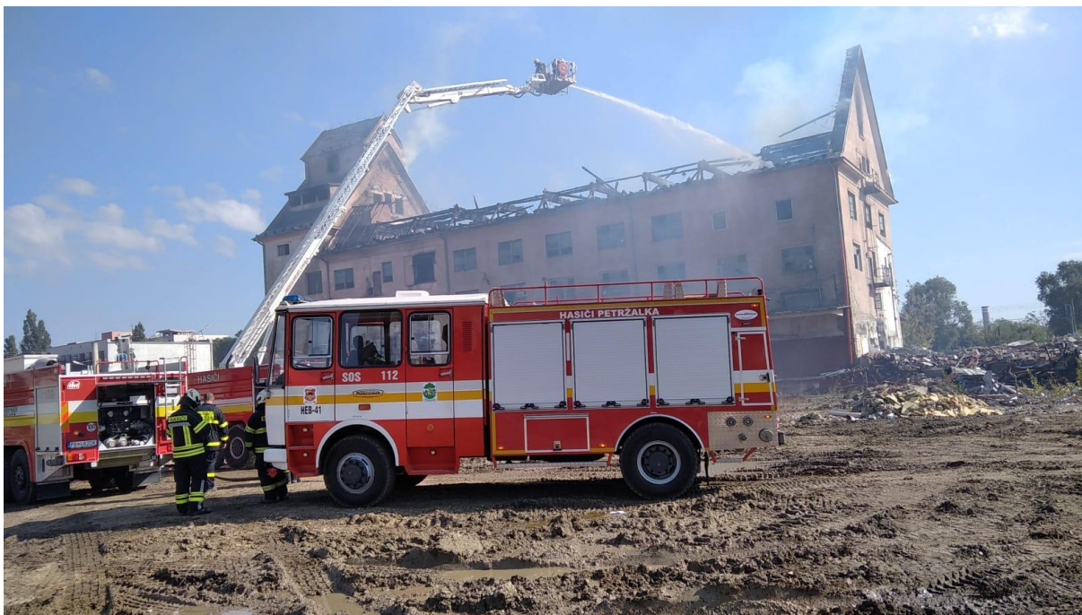
Požiar areál Palma a.s., Račianska, Bratislava 09.10.2021