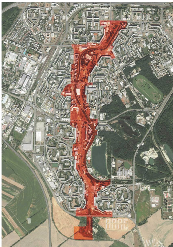
Centrálna rozvojová os mala byť architektonickou výkladnou skriňou Petržalky už od počiatkov budovania sídliska. | GRAFIKA: MIÚ Petržalka

Na marcovom zasadnutí mestského zastupiteľstva poslanci vzali na vedomie čistopis Urbanistickej štúdie