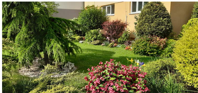
Predzáhradka na Wolkrovej 31, ktorá sa zúčastnila minuloročného ročníka súťaže.

Záhradkári, ktorí sa ešte necítia na to, aby prihlásili svoju predzáhradku do súťaže, pretože