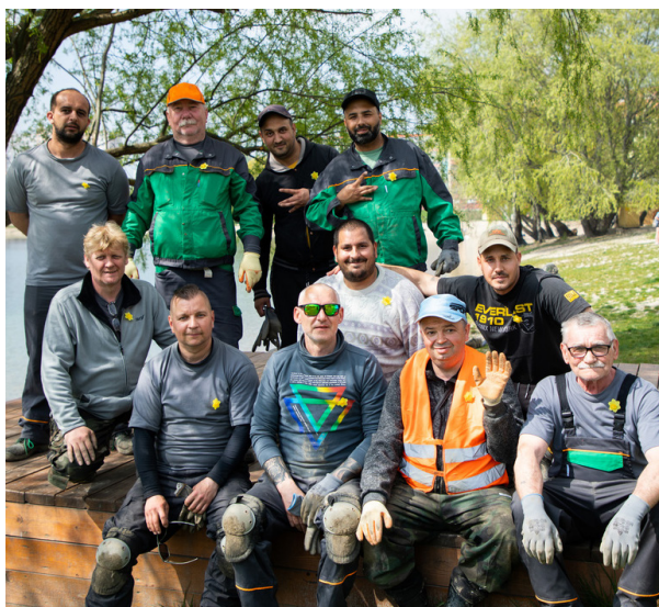
Oddelenie správy verejných priestranstiev aktuálne zamestnáva 160 pracovníkov. Táto partia upravila okolie Draždiaka.

Ako príklad uviedol partie zodpovedné za údržbu