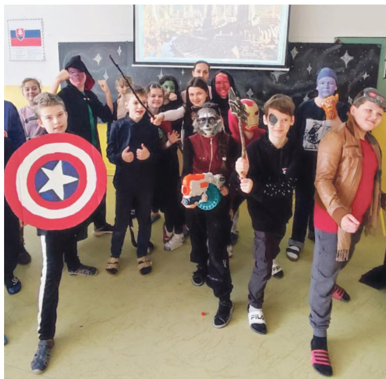
Projektový deň realizujú na ZŠ Lachova už pätnásť rokov. Tentoraz boli témou rozprávky.