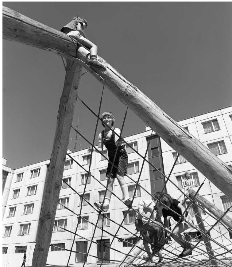
Lanová sieť sa po prvý raz objavila v časti Dlhé diely.