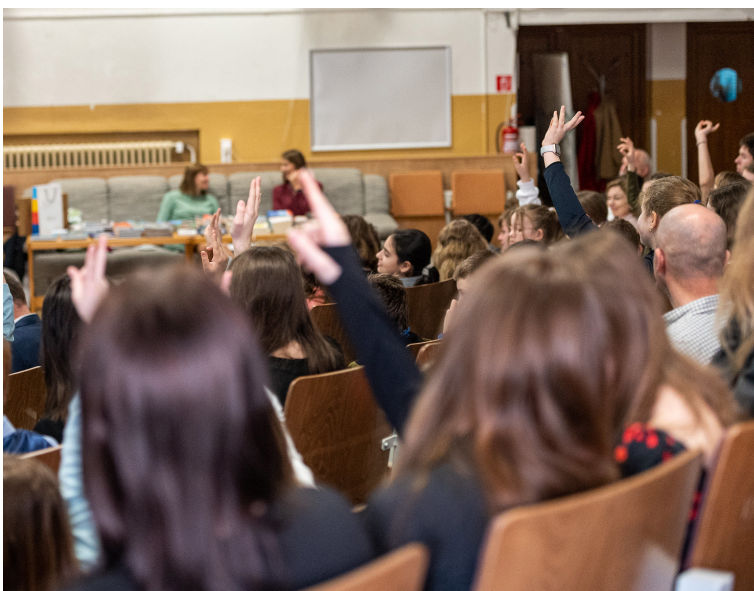
V rámci projektu Vráťme knihy do škôl škôlkári, školáci a stredoškôláci prečítali viac ako štyritisíc rôznych kníh.