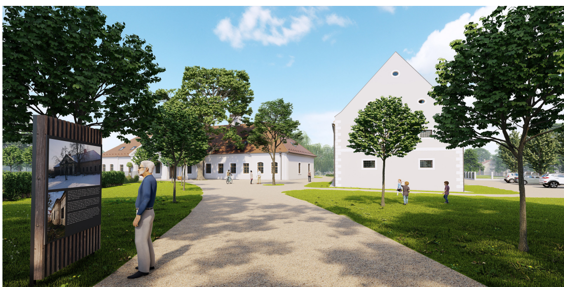
Rekonštrukciou čunovského kaštieľa vznikne Ekocentrum. Po dokončení v ňom budú prebiehať workshopy, letné tábory či prírodovedné výstavy.

životného prostredia a klímy, ale budú tiež motivovaní zaviesť udržateľné postupy do svojho každodenného života. Projekt je financovaný z programu cezhraničnej spolupráce Interreg SK-AT.