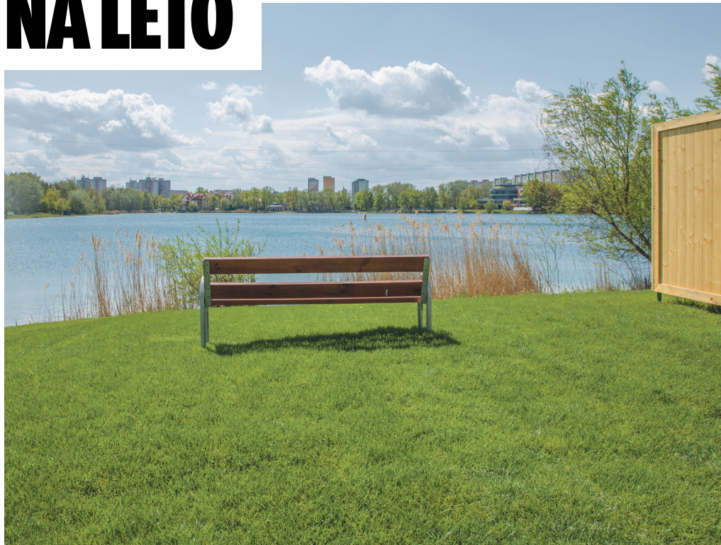
Okolie Draždiaka pred letom mení dizajn. Pribudla tráva aj nové kabínky na prezliekanie.

Príprava na položenie trávnik trvala tri dni, ďalšie tri si vyžiadalo následné uloženie nového