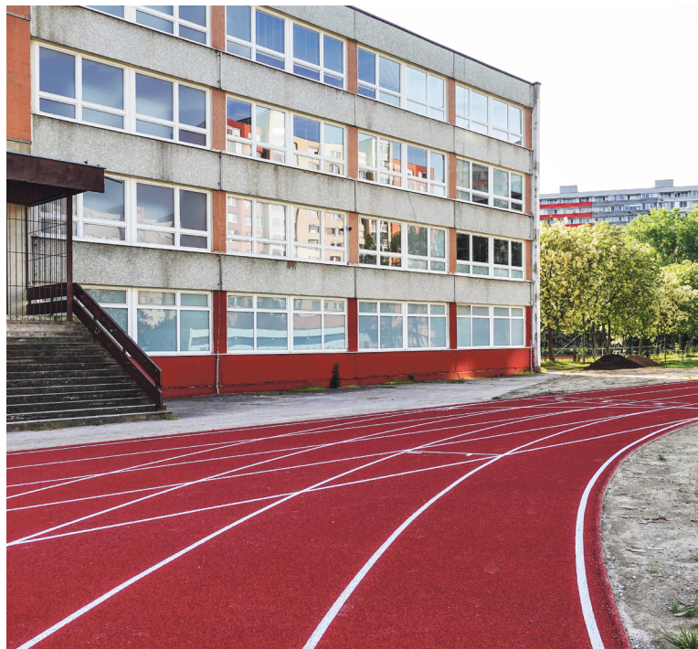
Dlhodobým cieľom Petržalky je postupná obnova jedenástich školských areálov.