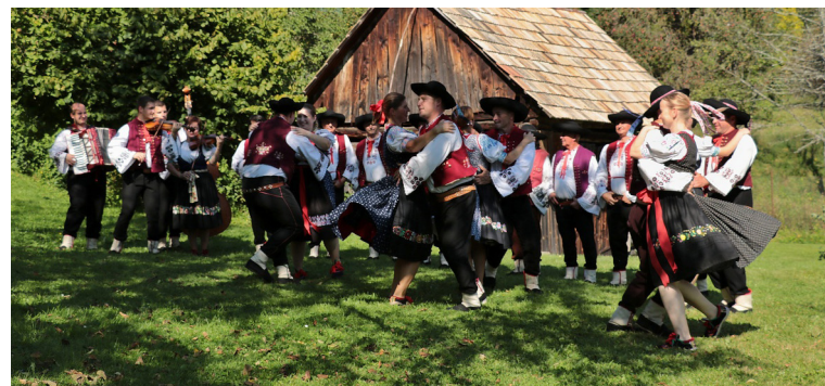
Folklórna skupina Záriečanka sa preslávila trojhlasným spevom.