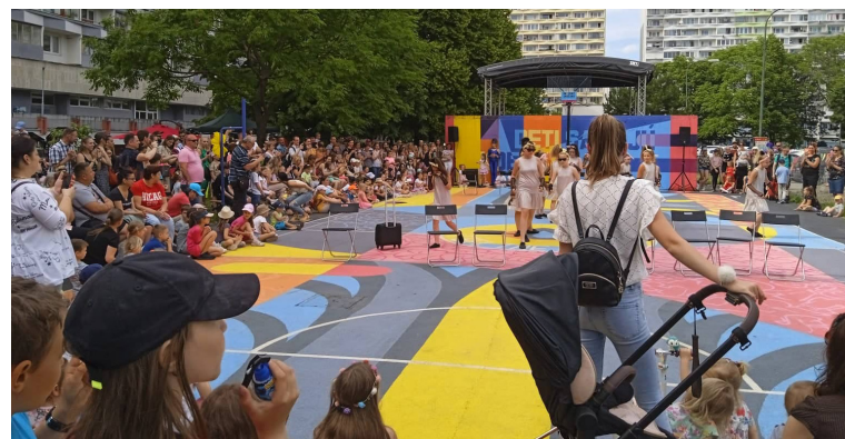
Deň detí si petržalské ratolesti vlani užili, bohatý program ich čaká aj tento rok.

Medzinárodný deň detí v Petržalke sa koná pod záštitou starostu Mestskej časti Bratislava-Petržalka Jána Hréku.