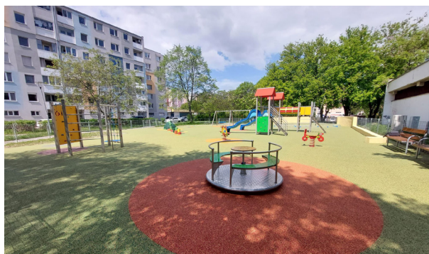
Vynovené ihrisko na Haanovej. Suma za rekonštrukciu sa vyšplhala na 120-tisíc eur.