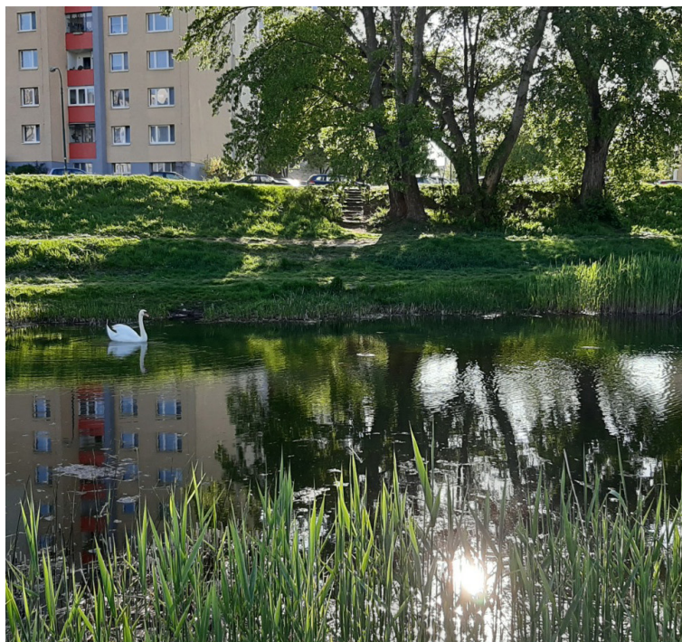
Agendu petržalského „životka“ rozširuje aj skutočnosť, že na území mestskej časti nájdete nielen zeleň, ale aj vodné plochy či chránené územia.

Mestská časť spolupracuje s obyvateľmi aj pri kompostovaní. „Pomohli sme záujemcom pri vybavení potrebných povolení, zasponzorovali sme aj nákup kompostérov. Komunitných kompostovísk je momentálne v Petržalke v prevádzke deväť, starajú sa o ne naše kompostmajsterky, dobrovoľníčky, ktoré usmerňujú obyvateľov, aby správne kompostovali,“ prezrádza Stanová. Kompost potom