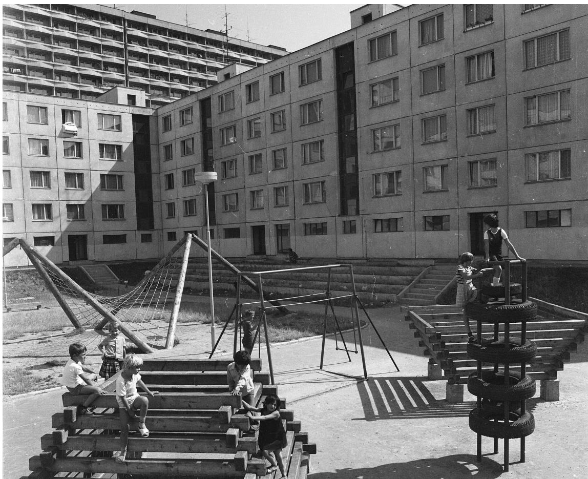
Petržalské ihriská boli „zapustené v teréne, autori počítali s tým, že v zime deti využijú svah na sánkovanie.

S realizáciou sa začalo koncom 70. rokov, presne v roku 1979, kedy vznikli v Zrkadlovom háji prvé tri vzorové ihriská určené pre deti, mládež a dospelých. Ako napísali ich autori v časopise Projekt v máji 1979, „realizácia bude prebiehať formou užívateľského experimentu, ktorého cie-