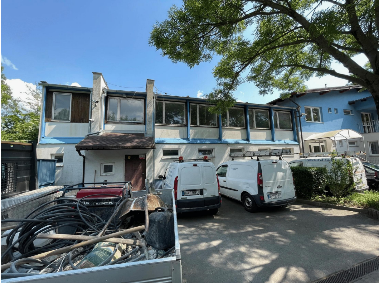
Foto: areál Kopčianska ul.