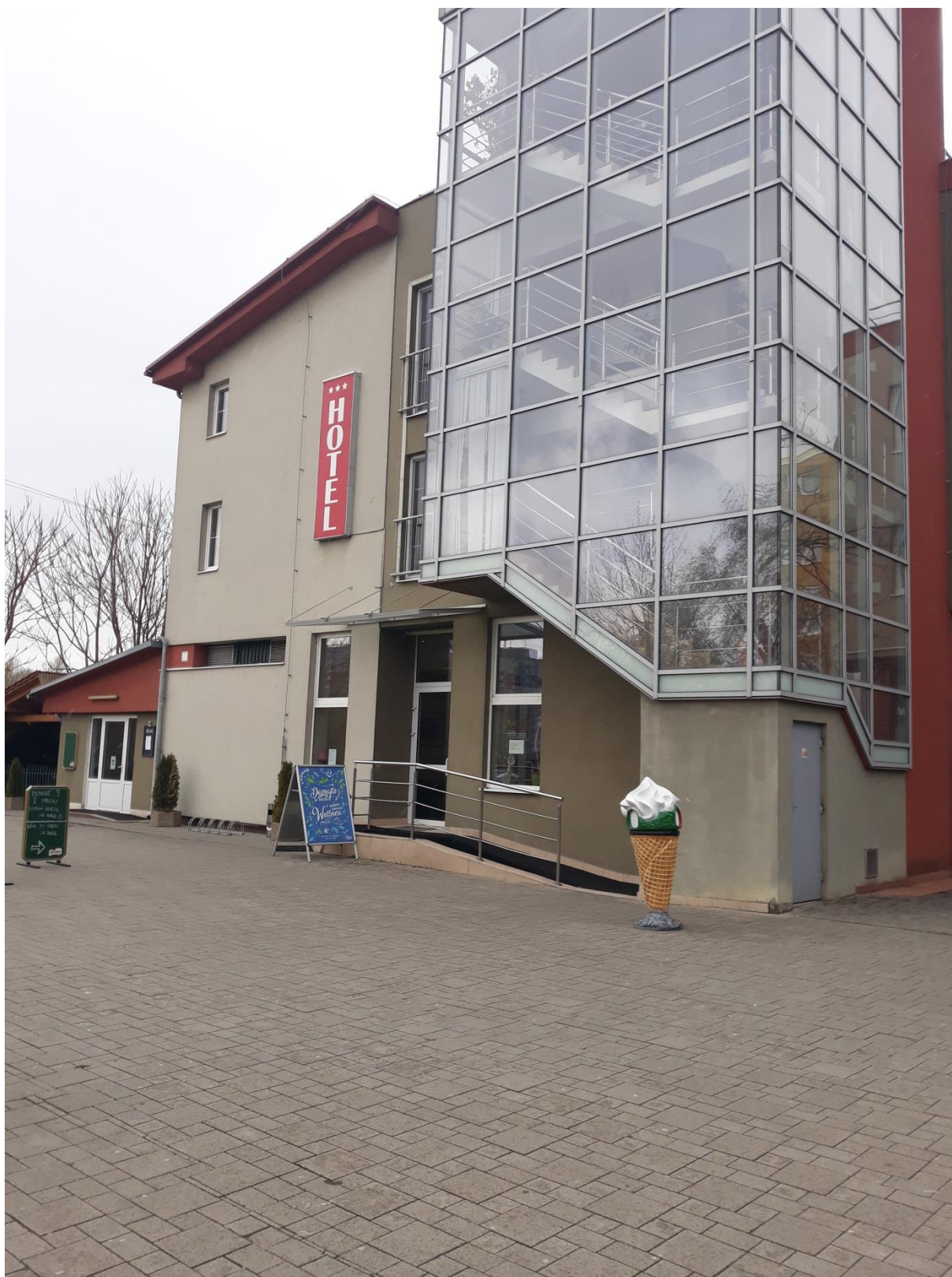
Foto : Penzion- Hotel Dominika, Wolkrova ul.