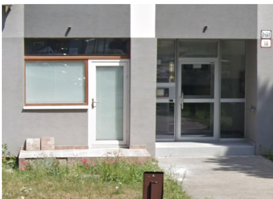
Nám. Hraničiarov 19 - prístupový chodník