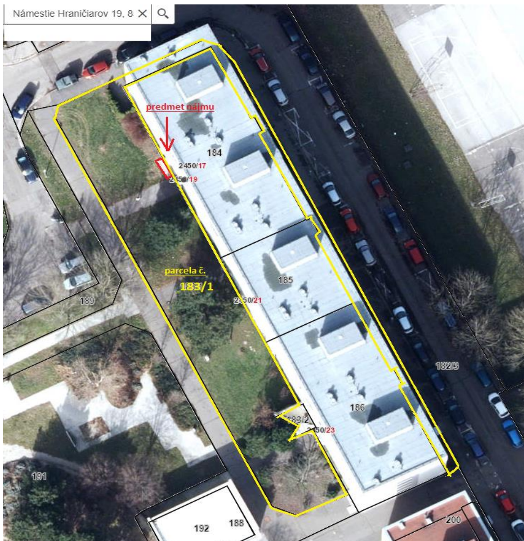
Nám. Hraničiarov 19 – mapa – situácia