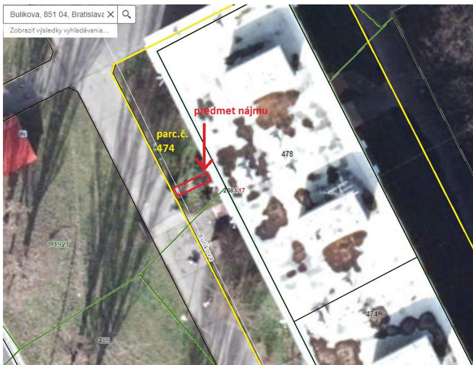
Bulíkova 17 – mapa - situácia