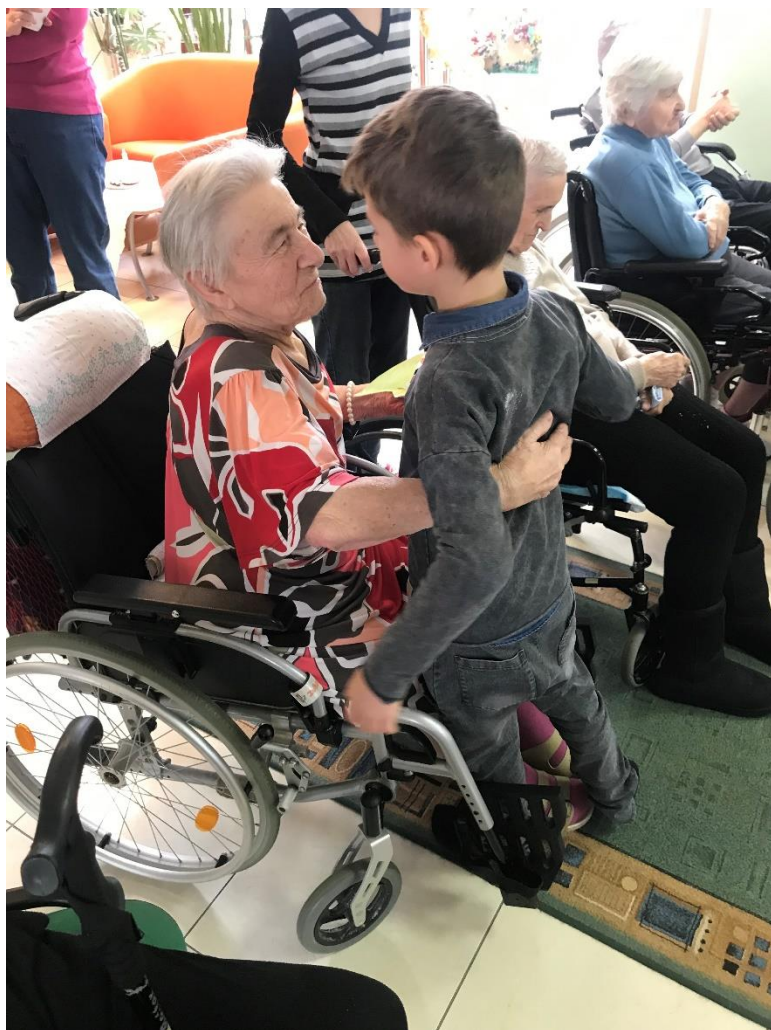
Príprava na Vianoce Sv. Omša