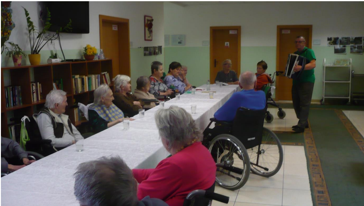
Oslava MDŽ s deťmi zo ZŠ Lachova