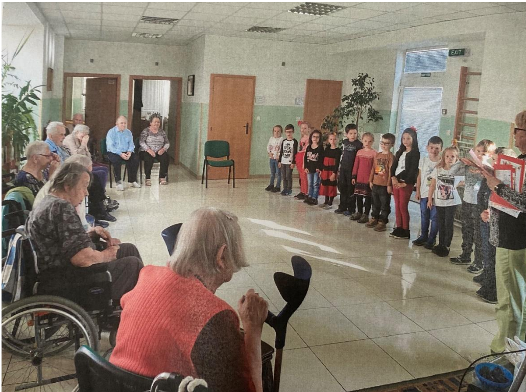
November Pečenie jablkovej štrúdle