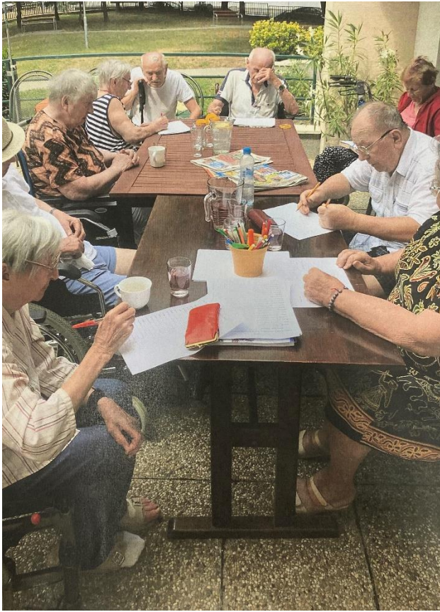
Október – Mesiac úcty k starším Deti zo ZŠ Lachova a ZŠ Felix k nám prišli vystúpiť