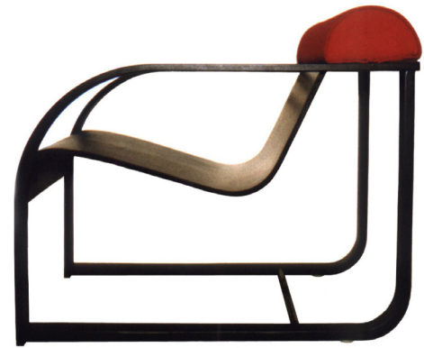
Lamelové kreslo Alto bolo poctou finskemu dizajnérovi Alvarovi Aaltovi.

Dušana Jurkoviča. „Interiérový dizajn nie je ľahký chlebiček. Veľa zákazníkov sa snaží onplynúť dizajnéra svojimi predstavami a vkusom. Dôležité je nezájsť za hranicu, ktorá by bola pre mňa neprijateľná. Našťastie, mal som najmä osvietených investorov, ktorí mi nechali voľnú ruku a vtedy vznikli najlepšie realizácie,“ hovorí.