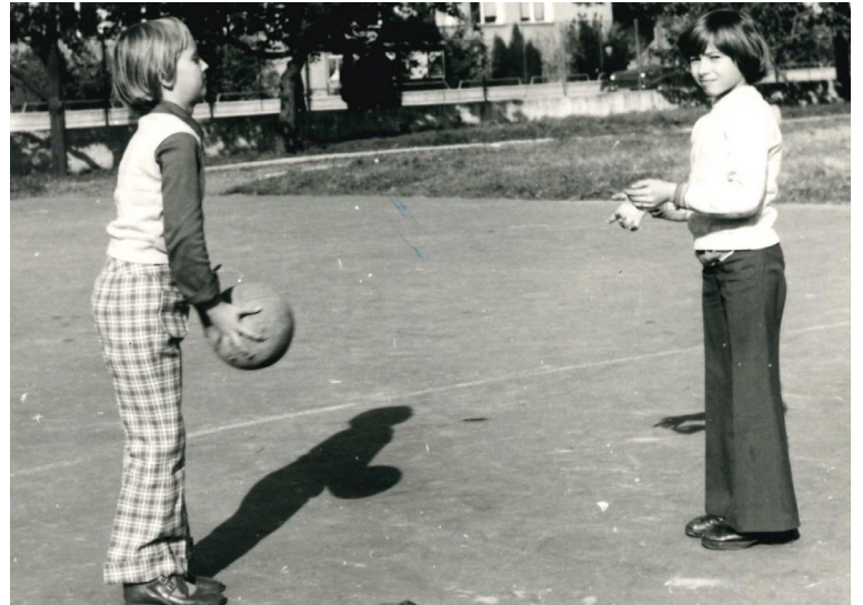
Mobily neexistovali, ani televízory nepatrili k výbave bežnej domácnosti, najviac času deti trávili vonku.

S hrôzou sme sledovali búranie rodinných domov v starej Petržalke, likvidáciu záhrad s marhuľovými stromami. Je pravda, že väčšina domov bola vlhká, postavená pred sto rokmi. Majitelia dostali štátne byty v panelákoch. Mnohí sa nedokázali zmieriť s tým, že nemajú záhradku, sliepky, vlastný dom. Niektorí starí ľudia od žiaľu zomreli.