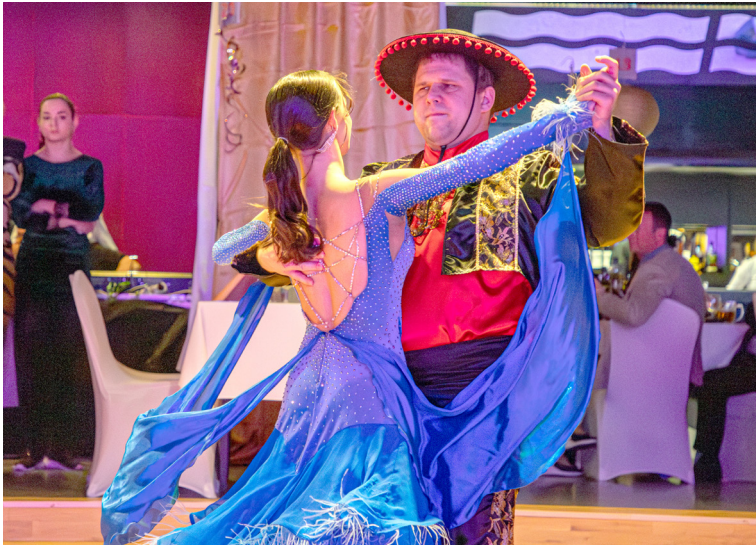
Pravidelnou súčasťou plesu je starostovský valčík.