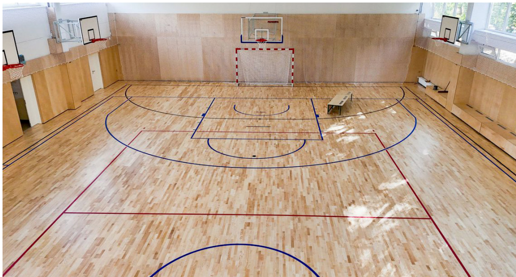
V zrekonštruovanej hale na Prokofievovej sú k dispozícii dve telocvične.

Mestská časť Bratislava-Petržalka ponúka na prenájom vnútorné priestory v zrekonštruovanej športovej hale na Prokofievovej ulici za prijateľné ceny. Na výber sú rôzne druhy športových aktivít.