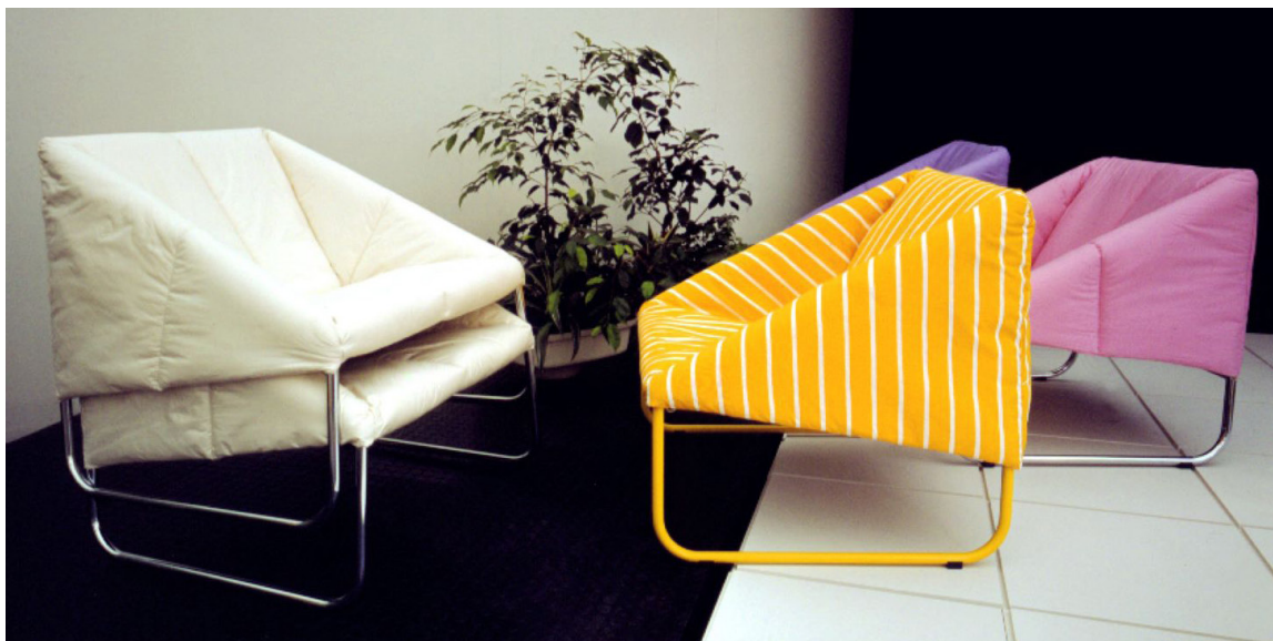
Terasové kreslá Wind navrhol v roku 1983 pre Kodrety Myjava. | Foto: Archív V. Ch.

A mimochodom, ak by ste mali chuť posedieť si v jeho slávnom kresle, stačí sa vybrať do Starého Mesta. „V jednej cukrárni na Dunajskej ulici ho použili dizajnéri, ktorí robili interiér a musím povedať, že vyzerá úplne súčasne, vôbec nie ako retro. Takéto veci ma vždy potešia.“