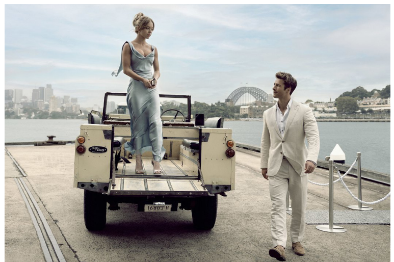
Valentínsky večer si môžete spríjemniť aj romantickou komédiou od amerického režiséra Willa Glucka, odborníka na vzťahy i rozprávky.

Zuzana Golianová, Kultúrne zariadenia Petržalky