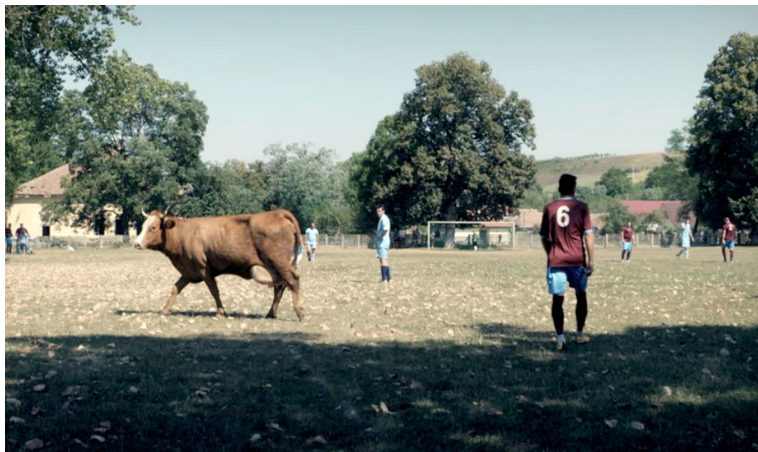
Rumunsko-slovenský dokument sa nakrúcal na slovenských dedinských ihriskách.