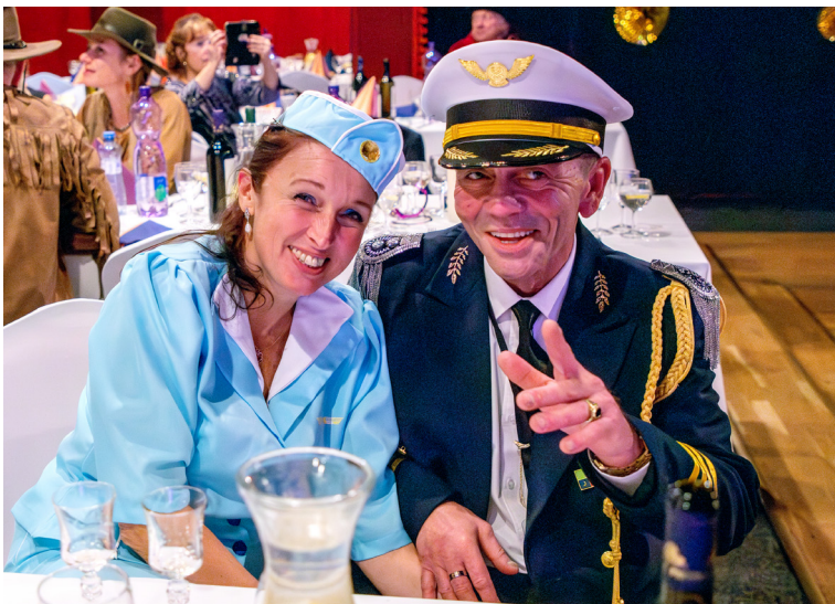
Pilot s pôvabnou letuškou „prileteli“ do Petržalky až z Kysuckého Nového Mesta.