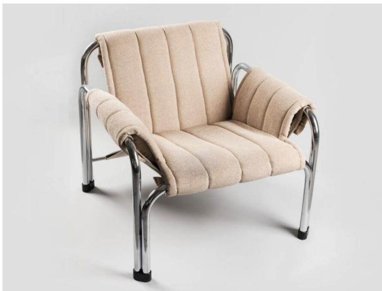
Kreslo T2403 v pôvodnej a najpredávanejšej verzii z rezného plátna.

Vytvorili štrnásť návrhov kresiel, stoličiek a stolíkov. Experimentovali ako v laboratóriu. Chceli vyskúšať čo najviac tvarov, povrchových úprav, materiálov a detailov. Kreslá z Chlebovej dielne z pochrómovaného kovu potiahnuté rezným plátnom (neskôr vznikli aj verzie s koženým čalúnením), ktoré sa na skelet upínali kovovými patentkami a dve stoličky navrhnuté Hreščákom zaujali hneď pri prvom predstavení v roku 1980 na Predajných výstavách spotrebného tovaru v Brne. „Naše návrhy získali tri zlaté medaily za dizajn a následne v Prahe ocenenie Vynikajúci výrobok roku za dizajn sedacieho nábytku.“ V roku 1982 si Chlebo odniesol hlavnú