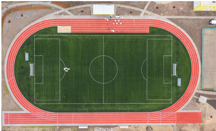
Rekonštrukcia športového areálu na Strednej priemyselnej škole elektrotechnickej K. Adlera v bratislavskej Dúbravke priniesla aj unikátny systém online rezervácií.

Aréna nebude jediné zrekonštruované divadlo.