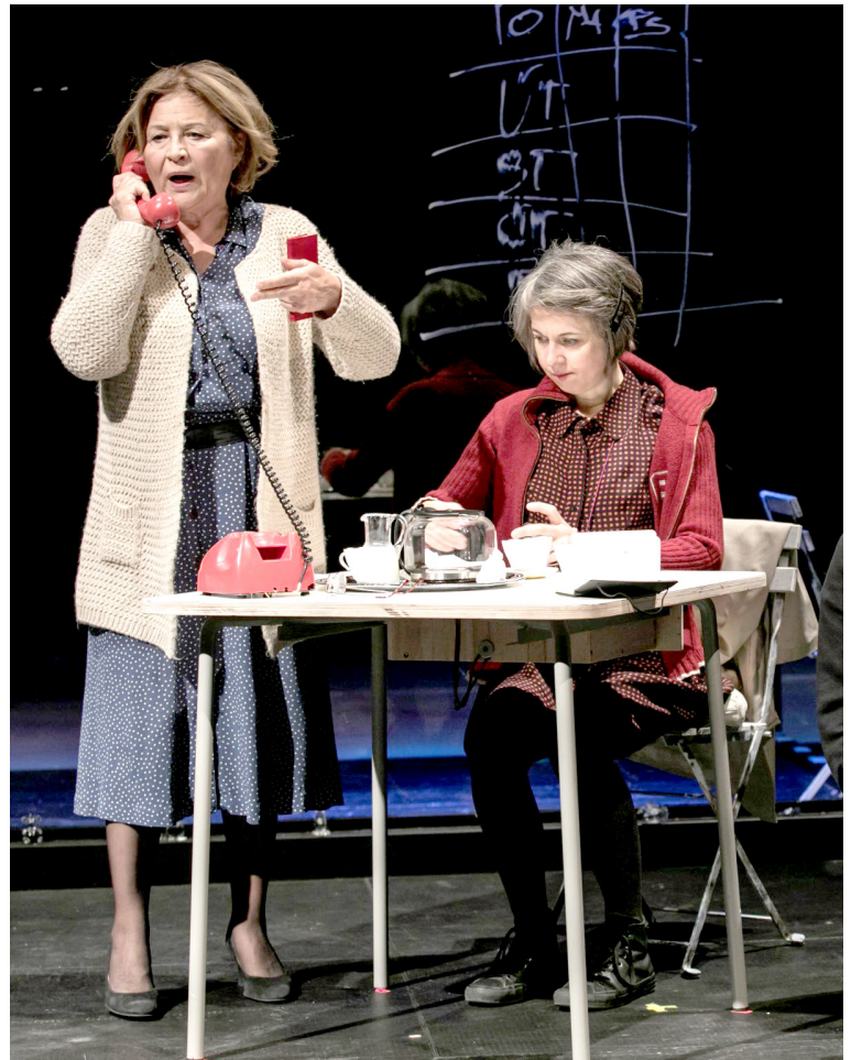
Rodinná dráma Tennesseeho Williamsa Sklenený zverinec

O cestách vlakom po malebnom Slovensku, o ľuďoch, ktorí sa v ňom stretávajú a o tom, kto je tajomný Miňo bude 23. februára o 19:00 situačná komédia Za meškanie sa ospravedľujeme .