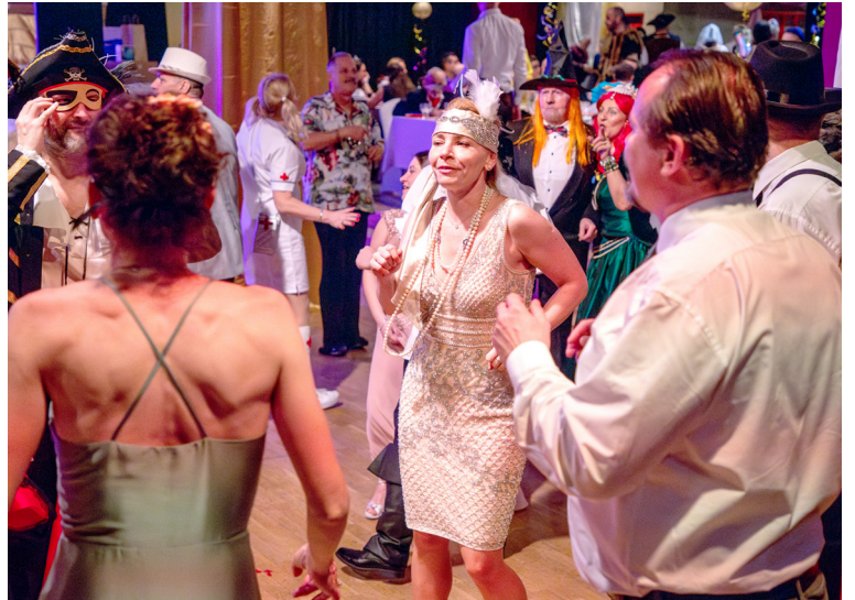
Oblíbené boli kostýmy v téme 20. rokov minulého storočia.