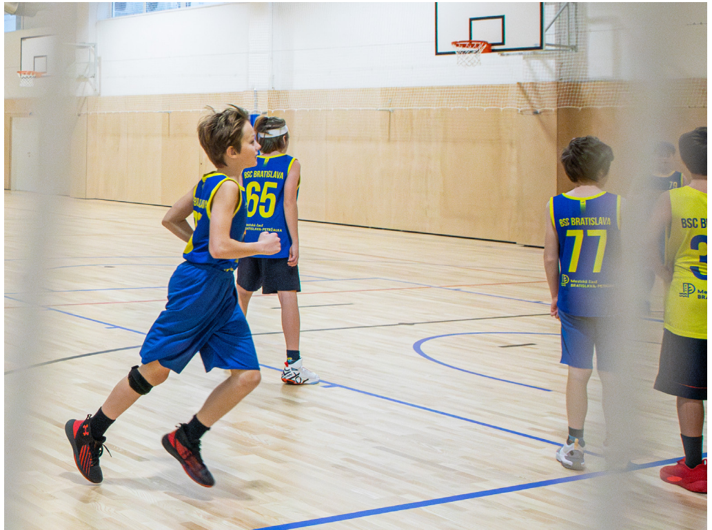
B.S.C. si vynovenú halu užíva plnými dúškami.

„V Petržalke doteraz nebola vhodná telocvičňa na oficiálne basketbalové zápasy. Sme však vďační, že nám bolo umožnené začať trénovať v zrekonštruovanej športovej hale Prokofievova. Deti vďaka tomu ušetria veľa času, ktoré by inak museli obetovať na cestovanie. Pevne veríme, že už čoskoro budeme pôsobiť výhradne na území našej mestskej časti,“ teší sa Ďuriš.