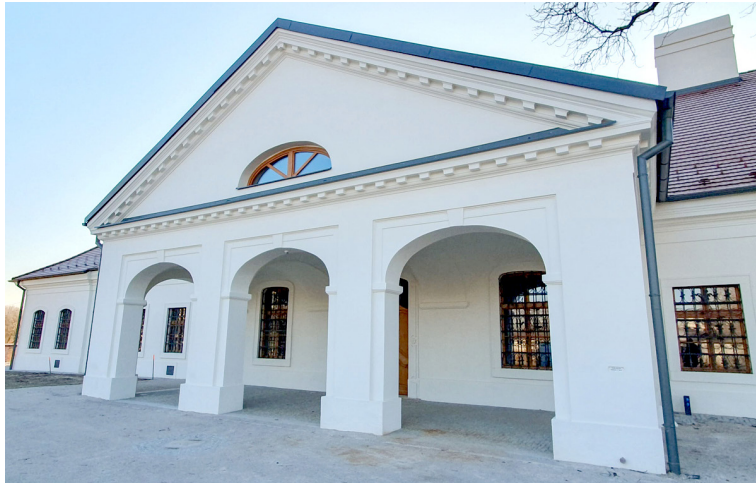
V čunovskom kaštieli našlo sídlo unikátne Ekocentrum.