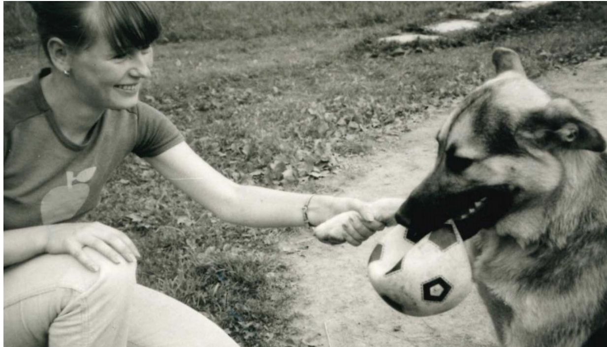
V každom dome v starej Petržalke mali psa alebo mačku. Psy strážili dom a dvor, mačky chytali myši. Mnohí ľudia chovali sliepky či králiky.

Ako prvý si pamätám vyschnutý Dunaj, z ktorého ostali len malé potôčky v koryte rieky. Náš dom bol na konci Macharovej ulice, pred nami boli len polia a na konci ulice hraničné pásmo. Dom patrilo povereníctvu pôdohospodárstva a bývali v ňom rodiny, ktorých otcovia na povereníctve pracovali. Všetci sme sa navzájom poznali, a keďže dom stál na veľkej parcele, mali sme trávnik, kde sme sa ako deti hrávali. Postupne naši otcovia vysadili stromy, potom postavili aj bazén, hojdačky, volejbalové ihrisko – v zime slúžilo ako klzisko.