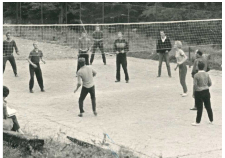
Otcovia postupne pri panelákoch vysadili stromy, postavili hojdačky aj volejbalové ihrisko – v zime slúžilo ako klzisko.

Aj náš dom neskôr zbúrali, dnes je na jeho mieste budova súdu. Rodičia dostali byt na ulici Bélu Kuna, dnes Gessayova. Prípado nám to smiešne, nik nevedel kto bol Béla Kun, ani Gessay. Na druhej strane to bolo otravné, lebo nájomníci museli vymeniť všetky doklady za nové.