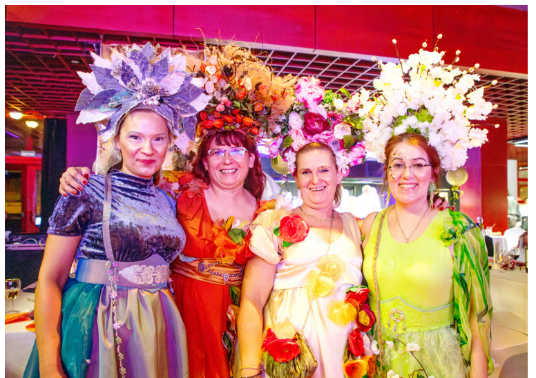
Štyri ročné obdobia – víťazná kolektívna maska.

Už dvadsiaty druhý rok sa masky zvieratiek, historických osobností či najrôznejších postaviek začiatkom februára stretávajú na tradičnom Petržalskom maškarnom plesu. Všetci sa zhodujú na jednom – tunajšia uvoľnená, neformálna atmosféra je ako žiadna iná. A tak sa na tanečnom parkete opäť bok po boku vykrúcali piráti s kovbojmi i jednorozcami za rytmov kapely Neon Fever a neskôr Dj-a Lomba.