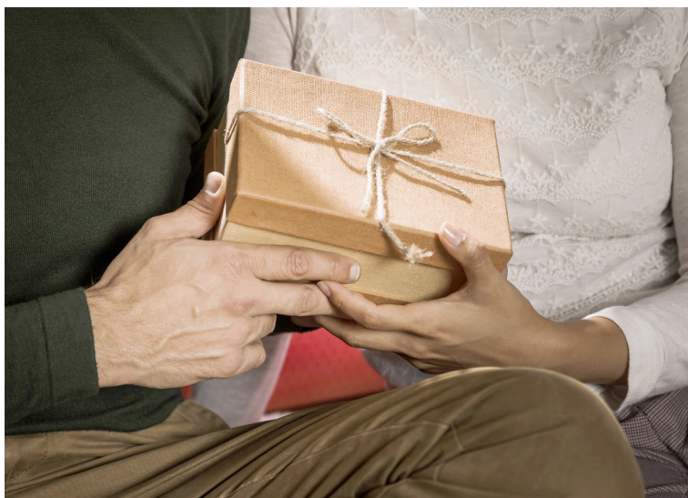
Darca je povinný pri ponuke daru prijímateľa upozorniť na vady, o ktorých vie.