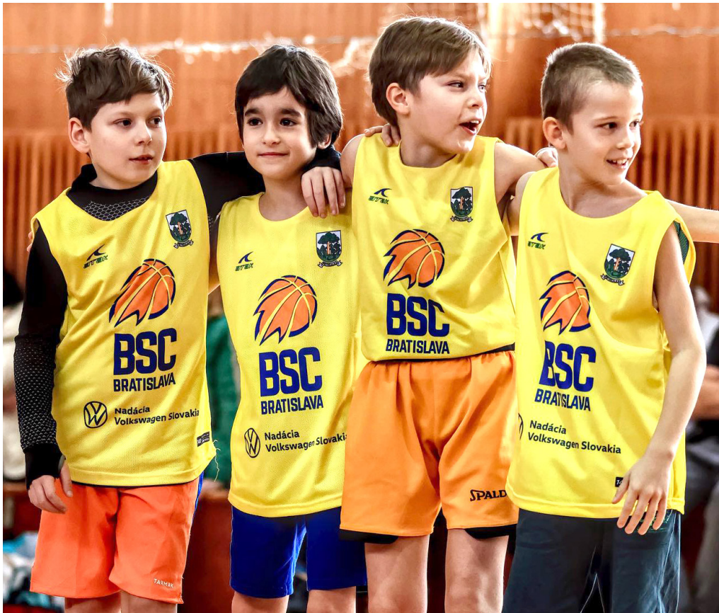
Súčasťou značky B.S.C. sú aj originálne dresy.