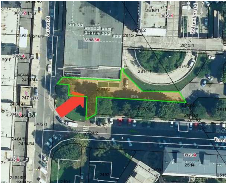
Parc.č. 2810/2 – Jasovská ul.