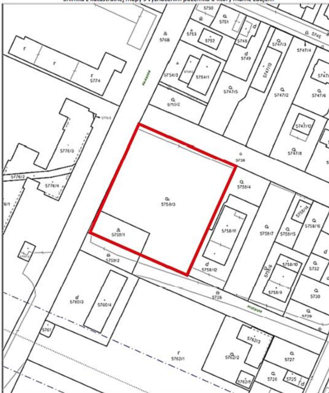
Snímka z katastrálnej mapy s vyznačením pozemku o ktorý máme záujem