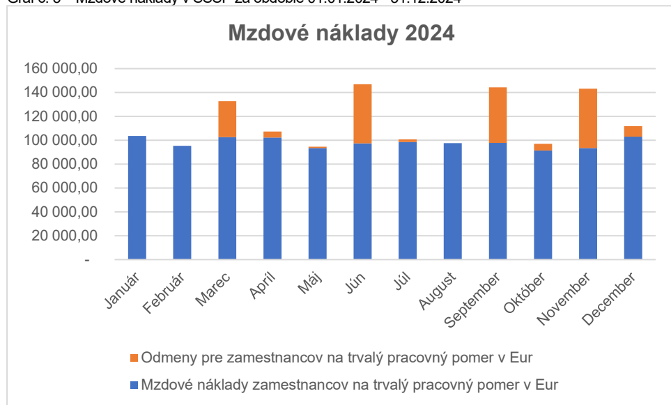
Graf č. 3 – Mzdové náklady v SSSP za obdobie 01.01.2024 - 31.12.2024