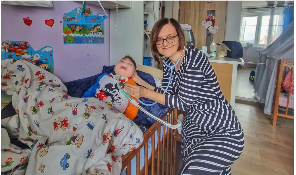
Detský domáci hospic Plamienok vznikol v roku 2003. Za ten čas už pomohol v najťažších chvíľach viac ako 600 rodinám s nevyliciteľne chorými deťmi.

Okrem tých dopravných možností, ktoré nám umožňujú postarať sa o deti vo väčšej vzdialenosti od Bratislavy, je to aj pokrok v prístrojovom vybavení. Napríklad domáca umelá pľúcna ventilácia alebo špecializovaná výživa, ktorá sa podáva priamo do žalúdka... To všetko znamená, že aj takéto deti dnes môžu byť doma a nie v nemocnici. Posun v liečbe v rôznych oblastiach je veľký. Existuje napríklad kašľací prístroj pre deti, ktoré majú problémy s vykašliavaním – vďaka nemu sa im výrazne uľaví a v konečnom dôsledku im to predĺži život. Výrazne sa rozšírilo použitie biologickej liečby. Myslím si, že vďaka tomu mnohé deti, ktoré vtedy patrili do paliatívnej medicíny, už do nej nepatria.