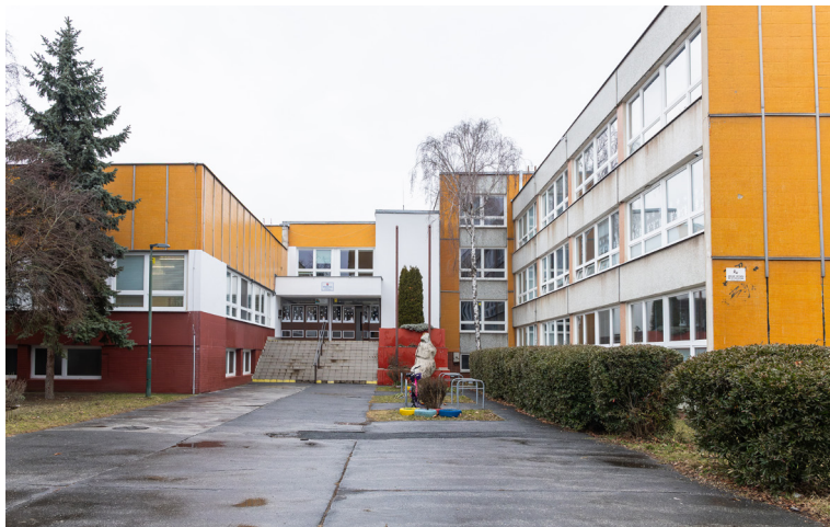
Veľkej obnovy za vyše 3,5 milióna eur sa po desiatkach rokov dočká aj Základná škola Gessayova.

pridalo aj zvyšných 9 základných škôl v zriaďovateľskej pôsobnosti mestskej časti. Okrem nich je fotovoltaika aj na Petržalskej plavárni a Športovej hale (ŠH) Pankúchova. Vyrobená energia slúži primárne pre ich vlastnú spotrebu, prebytky vyrobené najmä počas víkendov