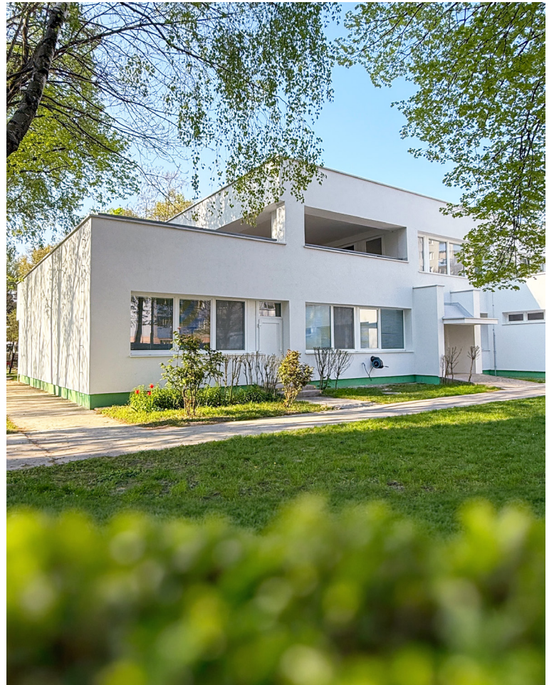
MŠ Ševčenkova je prvou zo zrekonštruovaných škôlok a vďaka tomu už od decembra 2025 benefituje zo zateplenej strechy i obvodového plášťa.

V pláne na rok 2026 je tiež veľká obnova Základnej školy na Gessayovej za vyše 3,5 milióna eur financovaná čiastočne z 20-miliónového úveru mestskej časti a čiastočne z externých zdrojov získaných zo SIEA, Program Slovensko vo výške cca 2,5 milióna eur. Projekt zahŕňa zateplenie fasády vrátane sokla, ostení a parapetov, úpravu a zateplenie striech s novou hydroizolačnou vrstvou