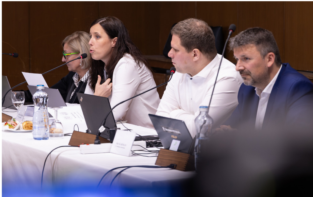
K najdôležitejším bodom aprílového zastupiteľstva patrilo schválenie čerpania ďalšej časti 20-miliónového úveru a kúpa pozemkov pod ZŠ a MŠ Turnianska.

Z 20-miliónového úveru (poslanci ho schválili koncom roka 2025) by sa mala uhradiť aj kúpa pozemkov v areáli ZŠ a MŠ Turnianska – čo bol ďalší dôležitý bod schválený v rámci aprílového zastupiteľstva. Škola i škôlka dodnes stoja na súkromných pozemkoch a samospráva má eminentný záujem tento problém čo najskôr vyriešiť. Financovanie kúpy pozemkov bude zabezpečené prostredníctvom už schváleného úveru s odkazom na uznesenie č. 507 zo dňa 18. novembra 2025, v ktorom boli vyčlenené financie na nákup pozemku pod ZŠ Turnianska. Majetkovoprávne vysporiadanie by sa malo zrealizovať za kúpnu cenu 1,5 milióna eur , ktorá bude uhradená v troch splátkach. Téma sa budeme osobitne venovať v niektorom z ďalších vydaní Našej Petržalky.