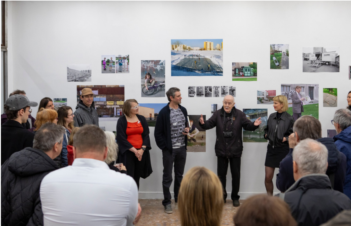
Výstava „dvorného“ fotografa Petržalky Juraja Bartoša v septembri 2025 patrila k najúspešnejším.