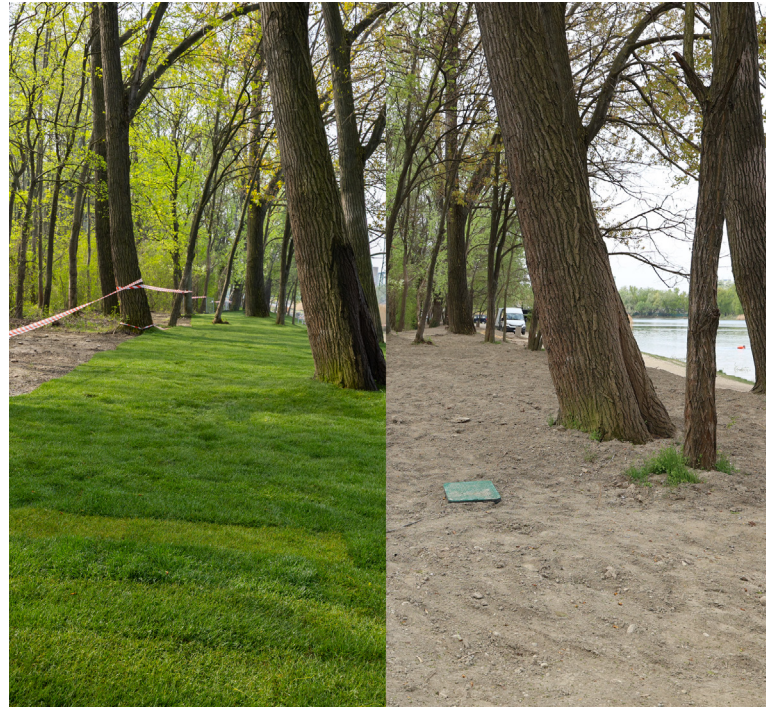
V apríli sa zazelenala ďalšia lokalita Veľkého Draždiaka. Celkovo pribudlo až 1 750 m 2 trávniku.