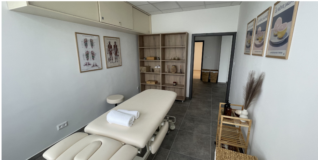
Multifunkčné wellness centrum bude slúžiť aj ako akreditované pracovisko pre odborné kurzy a certifikácie a vytvorí priestor na spoluprácu s lekármi, fyzioterapeutmi či ďalšími odborníkmi z praxe.

Župná zdravotnícka škola na Strečnianskej ulici má moderné simulačné centrum a zrekonštruovaný pavilón praktického vzdelávania.