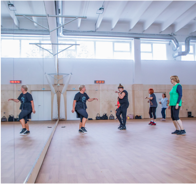
Ako prvú prevzala Petržalka do vlastnej správy halu na Prokofievovej. Zrekonštruovala ju a dnes už slúži klubom aj verejnosti.