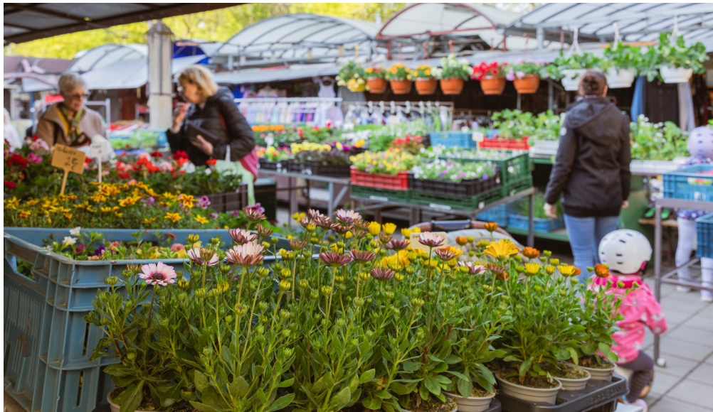
Trhovisko na Mlynarovičovej bolo vybudované v roku 1985. Mestská časť ho chce zrekonštruovať, návštevníkov sa pýta, ako by malo vyzerať.

Miesto, kde si kupujete čerstvú zeleninu, kvety, sezónny sortiment či len tak prehodíte pár slov so známymi. Trhovisko na Mlynarovičovej je tu s nami už vyše štyridsať rokov – a teraz je čas posunúť ho ďalej. Chceme, aby zostalo tým, čím je dnes, no zároveň, aby lepšie slúžilo všetkým, ktorí ho radi navštevujú. A práve preto potrebujeme váš názor.