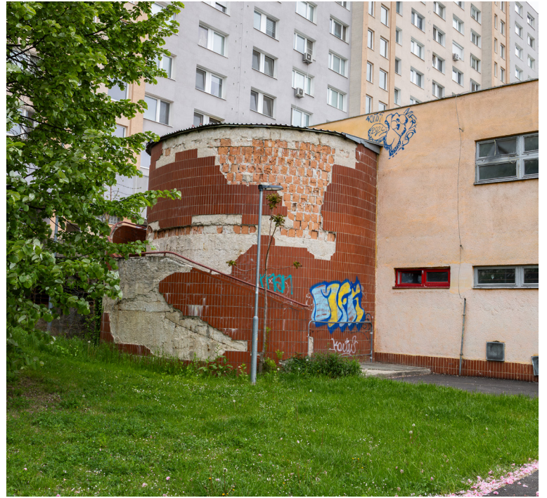
Športová hala na Znievskej je prenajatá súkromníkovi od roku 2003. Už na prvý pohľad nie je v dobrom stave.

a škôlky ju môžu využívať celkom zadarmo.