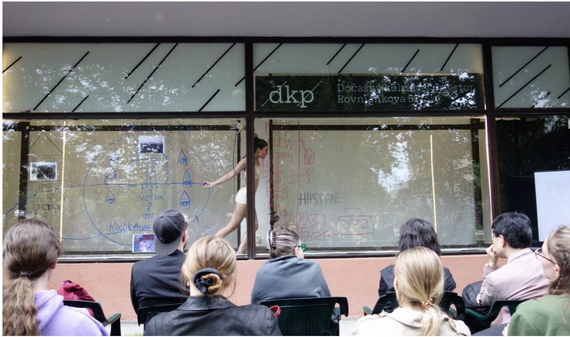
Jedným z kľúčových faktorov úspechu galérie /dkp/ je jej otvorenosť. Doslova aj metaforicky. Presklený výklad umožňuje nahliadnuť dovnútra bez bariér, čo láka aj náhodných okoloidúcich.

Mal slúžiť na jediné podujatie. Dočasný kultúrny priestor už dva a pol roka kultivuje ľudí aj okolie.