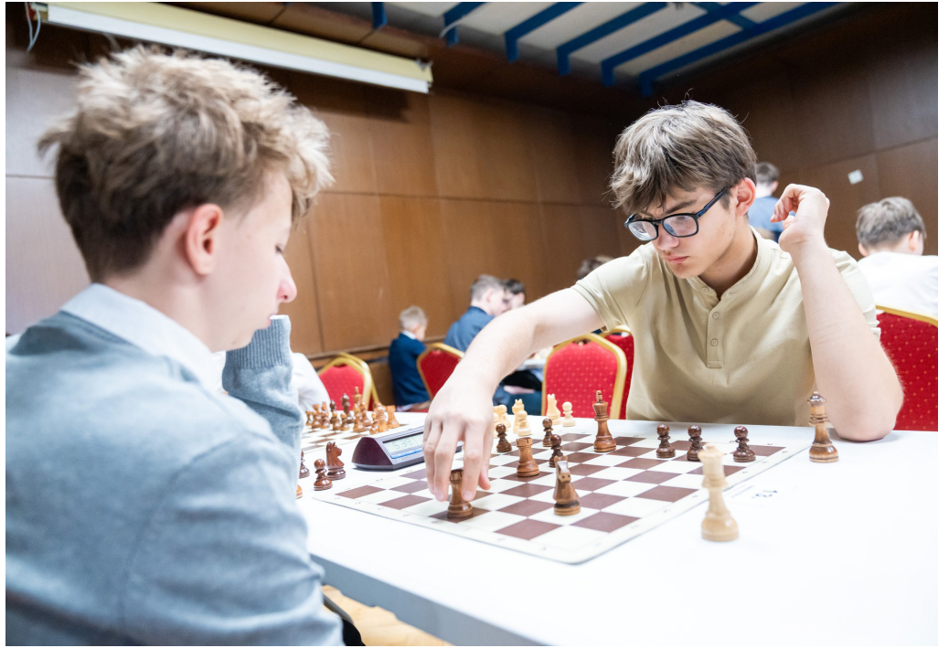
Nezaškodilo by, ak by sa šach v budúcnosti vyučoval ako regulárny predmet. Viac malých šachistov znamená vyššiu šanca objaviť výnimočné talenty.

„A tiež fyzicky náročný,“ podotýka Vrba. Neuveriteľné? Ale áno! „Predstavte si, že v štandardnom šachu trvá partie 4-5 hodín, pričom podujatie trvá deväť dní, a vy celý ten čas musíte sedieť na jednom mieste, absolútne koncentrovaní. To znamená, že telo