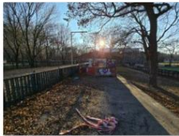
✓ Exteriér 17