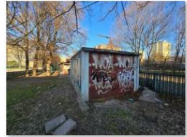
✓ Exteriér 15