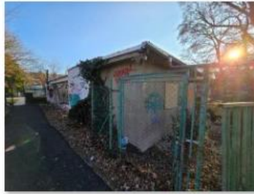
✓ Exteriér 14