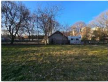
✓ Exteriér 13