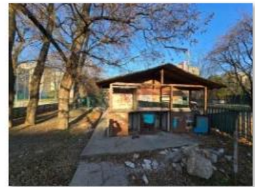
✓ Exteriér 18