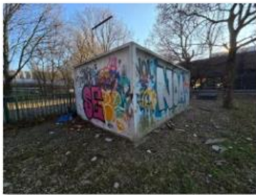
✓ Exteriér 16